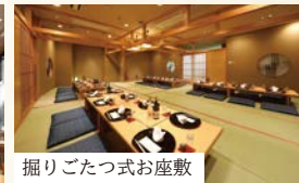
掘りごたつ式お座敷