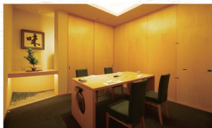
テーブル個室《最大12名様》